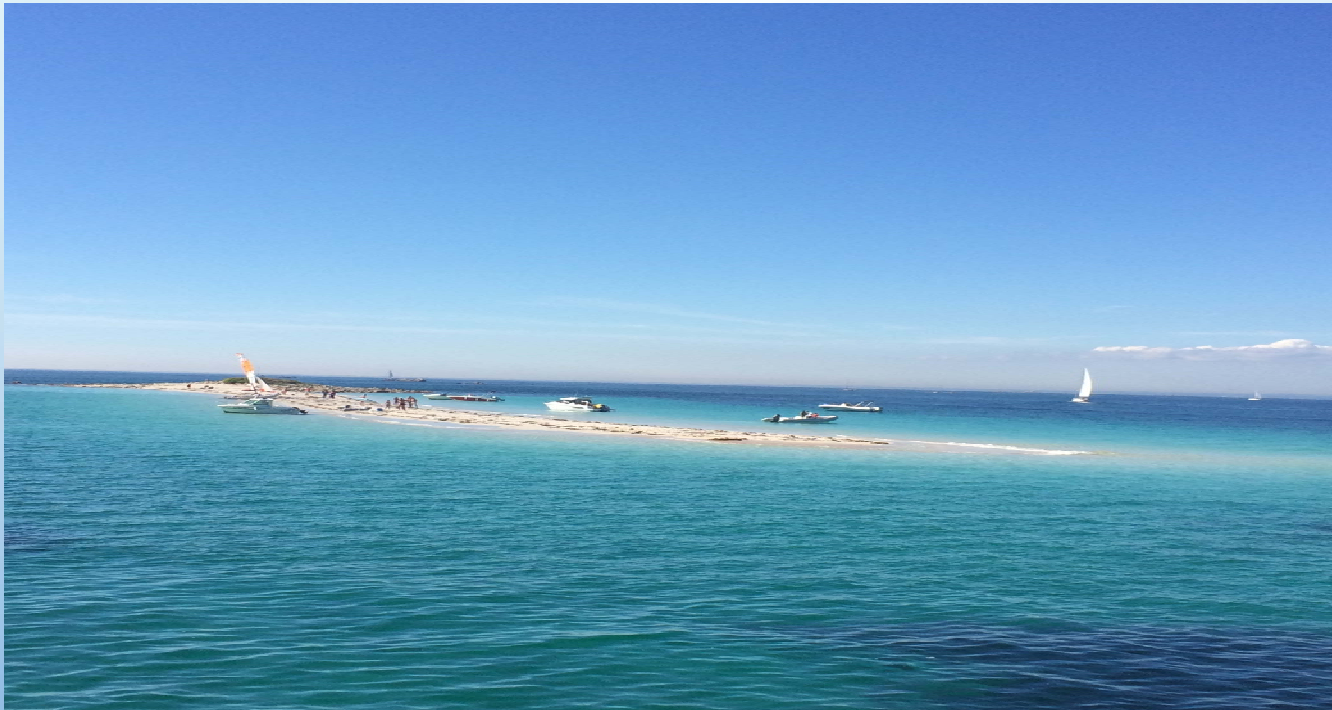
Ile de Glenan