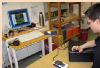
Stiwell med 4®