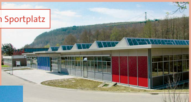
Werkstatt am Sportplatz