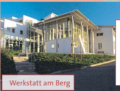
Werkstatt am Berg

Johannes-Diakonie Mosbach Neckarburkener Straße 2-4 74821 Mosbach Tel.: 06261/88-599 Fax: 06261/88-672 E-Mail: WfbM.Mosbach@johannes-diakonie.de